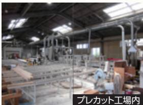
プレカット工場内

大正10年5月に個人企業として製材業を開業、昭和22年1月に川崎工業有限会社を設立しました。その後、木材の販売・