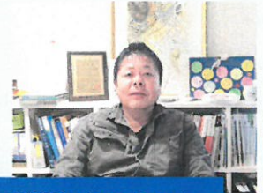
工務店 Business Report 株式会社 ハウジング進栄